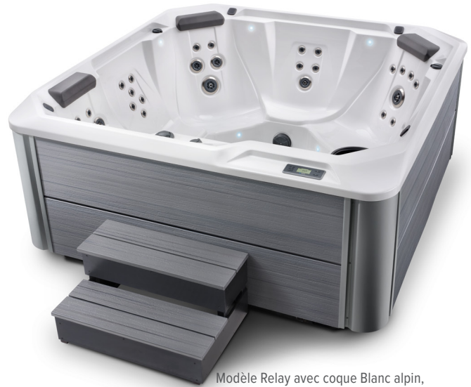
Modèle Relay avec coque Blanc alpin, habillage Gris orage et marche de la collection Hot Spot Gris orage.